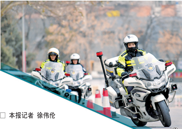
□ 本报记者 徐伟伦

驾驶警用摩托驶入校园为师生们带去“交通安全第一课”,引得孩子们一片欢呼;保障中非合作论坛峰会驻地周边交通安全,赢得外宾频频点赞……进入9月,今年初正式亮相的首都铁骑女警步履不停,用“飒”与“专”展现着北京交警的新时代风采。