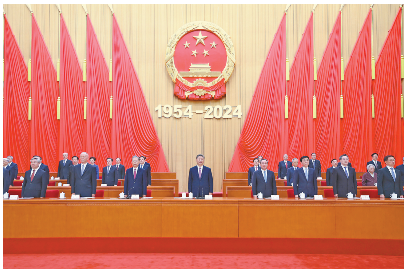
9月14日上午,中共中央、全国人大常委会在北京人民大会堂隆重举行庆祝全国人民代表大会成立70周年大会。习近平、李强、赵乐际、王沪宁、蔡奇、丁薛祥、李希、韩正等出席大会。

新华社北京9月14日电 中共中央、全国人大常委会14日上午在人民大会堂隆重举行庆祝全国人民代表大会成立70周年大会。中共中央总书记、国家主席、中央军委主席习近平出席会议并发表重要讲话。他强调,要进一步坚定道路自信、理论自信、制度自信、文化自信,发展全过程人民民主,坚持好、完善好、运行好人民代表大会制度,为实现新时代新征程党和人民的奋斗目标提供坚实制度保障。