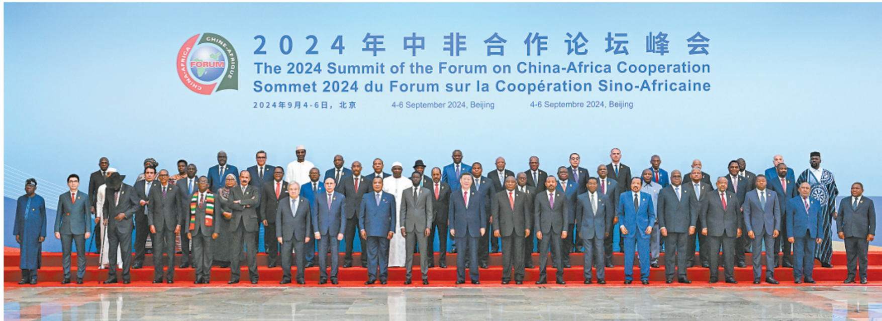
9月5日上午，国家主席习近平在北京人民大会堂出席中非合作论坛北京峰会开幕式并发表主旨讲话。这是开幕式前，习近平同出席峰会的外方领导人集体合影。

新华社北京9月5日电 记者杨依军 孙奕 9月5日上午，国家主席习近平在北京人民大会堂出席中非合作论坛北京峰会开幕式并发表主旨讲话。习近平宣布，中国同所有非洲建交国的双边关系提升到战略关系层面，中非关系整体定位提升至新时代全天候中非命运共同体，将实施中非携手推进现代化十大伙伴行动。