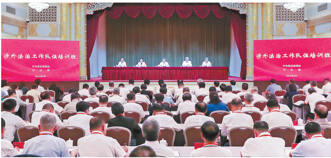
九月二日，中共中央政法委员会、中央政法委员会书记陈文清出席中央依法治国办、司法部举办的涉外法治工作队培训班开班式并讲话。

本报北京9月2日讯 记者王斗斗 赵婕 中共中央政治局委员、中央政法委书记陈文清2日在中央依法治国办、司法部举办的涉外法治工作队培训班开班式上强调，要全面贯彻党的二十大和二十届二中、三中全会精神，深入学习贯彻习近平法治思想，着力打造高素质专业化涉外法治工作队，为全面推进强国建设、民族复兴伟业作出新的更大贡献。