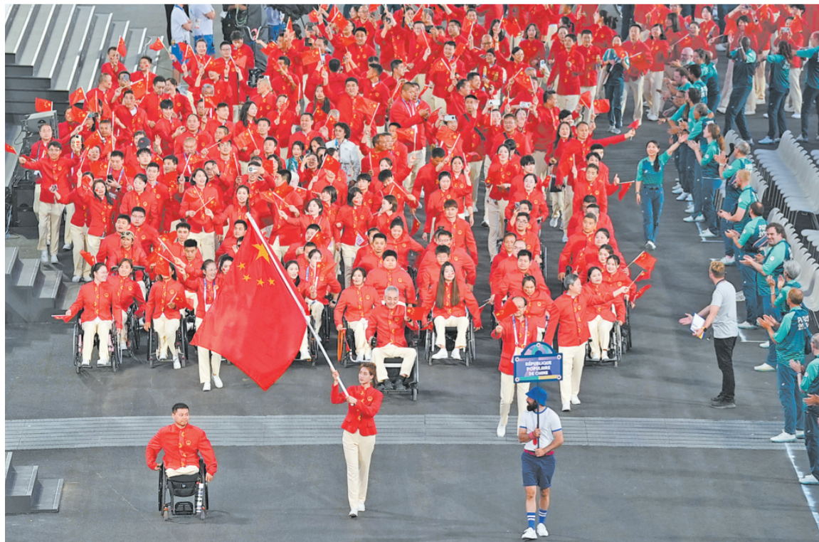
八月二十八日，第十七届夏季残疾人奥林匹克运动会开幕式在法国巴黎举行，图为中国体育代表团在开幕式上入场。

工厂、学校、卫生院离家都不远，生活工作方便；小区住宅整齐明亮，道路洁净通畅； 下转第二版