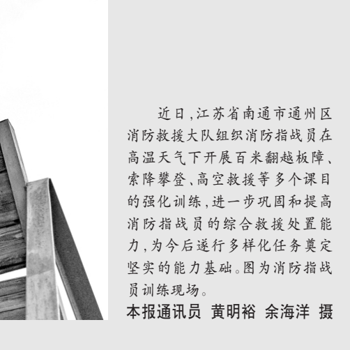
近日，江苏省南通市通州区消防救援大队组织消防指战员在高温天气下开展百米翻越板障、索降攀登、高空救援等多个课目的强化训练，进一步巩固和提高消防指战员的综合救援处置能力，为今后遂行多样化任务奠定坚实的基础。图为消防指战员训练现场。

随着行政复议惠企措施深入实施，稳企护商切口的多点深入，抚顺市先后推出涉企案件听证前置、快速受理、听取专家意见、送法进企业等创新举措。近三年来，涉企案件已实现听证率100%，行政机关负责人参加听证率100%，行政复议案结案了率达75%以上，为企业直接减少损失近80万元。行政复议化解行政争议主渠道作用日益明显，行政相对人的获得感和满意度显著提升。