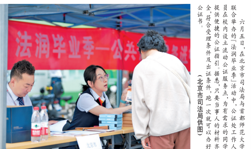
六月五日，在北京市司法局与首都师范大学联合举办的“法治润毕业季”活动中，公证处工作人员提供便捷的公证指引、据实、只要当事人材料齐全符合受理条件及出证条件，跑一次就可以办好公证书。

岁月如梭，时间永进。回首改革开放走过的历程，会发现改革与法治，始终相辅相成、相互依存。党的十一届三中全会开启了改革开放和社会主义现代化建设历史新时期，以改革催生了法治；党的十八届三中全会开启了全面深化改革、系统整体设计推进改革新时代，以法治引领了改革。 在改革开放的浪潮中，司法行政部门激流勇进，深入践行习近平法治思想，紧紧围绕党的中心任务履职尽责，不断深化司法行政改革，奋力推进全面依法治国和司法行政工作高质量发展，为全面建设社会主义现代化国家开好局起好步提供有力法治保障。