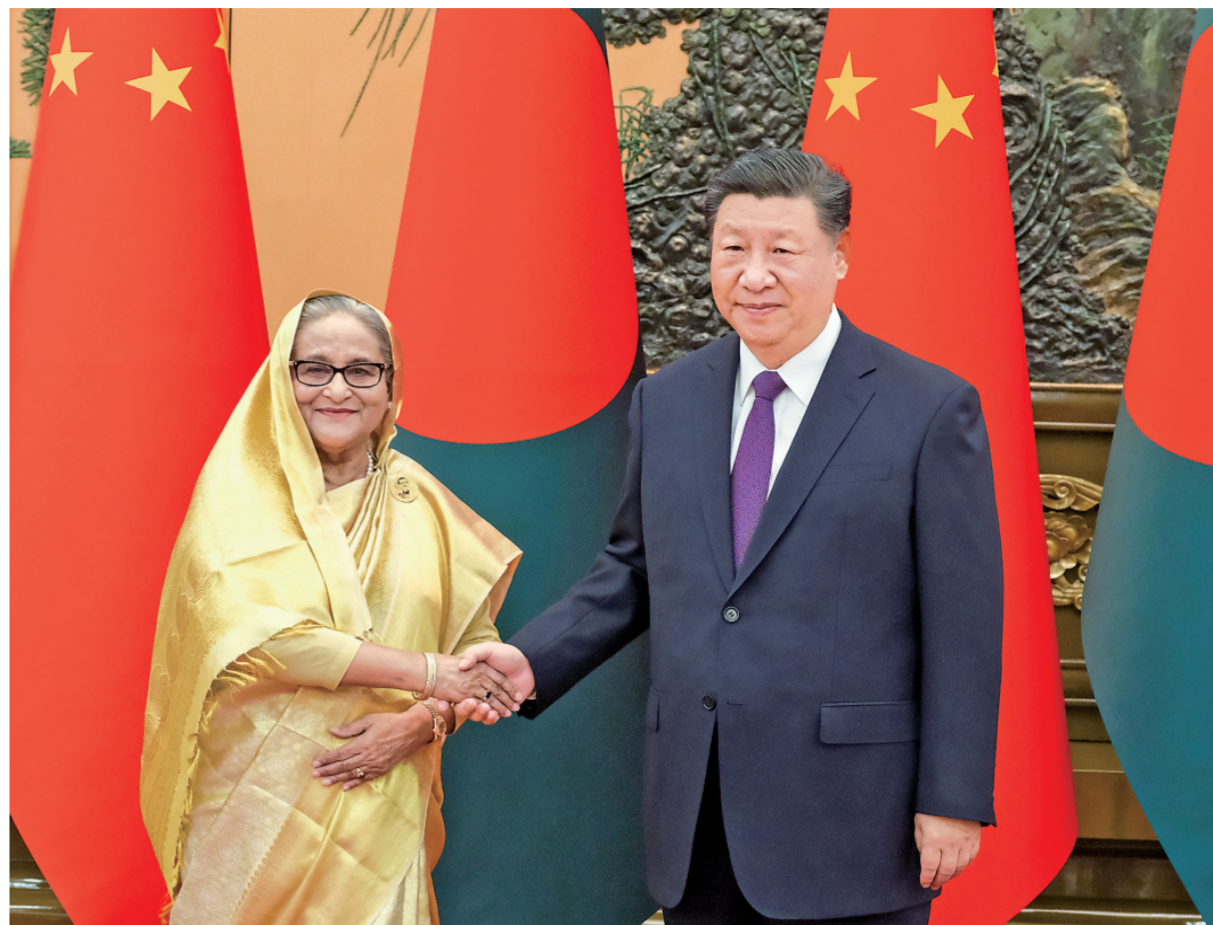
七月十日下午，国家主席习近平在北京人民大会堂会见来华进行正式访问的孟加拉国总理哈西娜。

新华社北京7月10日电 记者郑明达 七月十日下午，国家主席习近平在北京人民大会堂会见来华进行正式访问的孟加拉国总理哈西娜。两国领导人宣布，将中孟关系提升为全面战略合作伙伴关系。 习近平指出，中国和孟加拉国是相知相交的友好近邻，两国友好往来绵延千年。建交以来，两国始终相互尊重、相互支持、平等相待、合作共赢，树立了国与国之间尤其是“全球南方”国家间友好交往、互利合作的典范。中方珍惜中孟两国老一辈领导人缔造的深厚友谊，愿以明年建交50周年为契机，深化高质量共建“一带一路”，拓展各领域合作深度和广度，推动中孟全面战略合作伙伴关系行稳致远。