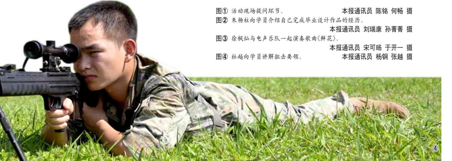
图① 活动现场提问环节。 图② 朱杨柱向学员介绍自己完成毕业设计作品的经历。 图③ 徐枫灿与电声乐队一起演奏歌曲《鲜花》。 图④ 杜越向学员讲解狙击要领。