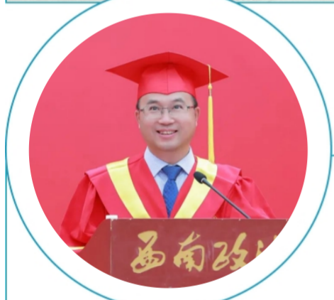
□ 林维 (西南政法大学校长)

西南政法大学校长林维表示，超大城市治理是国家治理体系和治理能力现代化的重要内容。近年来，西南政法大学系统性、集成性地研究城市治理理论和实践问题，围绕城市社会治理创新、城市形象建构、城市更新、城市社区治理、城市安全维护等出版著作20部，呈报城市治理主题决策咨询报告60余份，为服务超大城市治理作出了积极努力。未来，西南政法大学城市治理与发展研究院将遵循“立足重庆，辐射全国”的工作理念，为推动超大城市实现“善治”“智治”“共治”，走出一条中国特色的城市发展之路作出贡献。