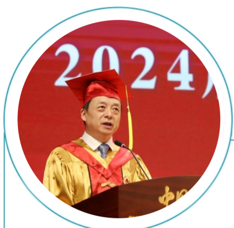
□ 马怀德 (中国政法大学校长)

光阴荏苒，岁月如梭。在这个礼堂迎接大家的情景还历历在目，转眼又到了送别的时候。这几年，我们共同经历了很多重要时刻，拥有了很多难忘的记忆：我们庆祝了中国政法大学建校70周年；成功举办了两届“世界法学家论坛”；圆满完成了第二轮国家“双一流”中期建设目标；纪检监察学院、国家安全学院先后成立；中央政法培训学院、全国唯一的法学教材研究基地、综合类涉外法治人才培养基地落户法大；你们在多项国内外重大赛事中不断刷新历史纪录，还有幸成为新教学图书馆综合楼和新食堂的第一批用户，大家的羽毛球馆等运动场所升级换代，校园餐厅从Mini版变成了Plus版，新一号楼地下空间改造成了“一站式”学生社区；NFC校园卡、充电桩、直饮水机让校园生活更便捷、更舒适。感谢大家一直以来的理解和支持，我们的“小破法”一天天在变得更好！