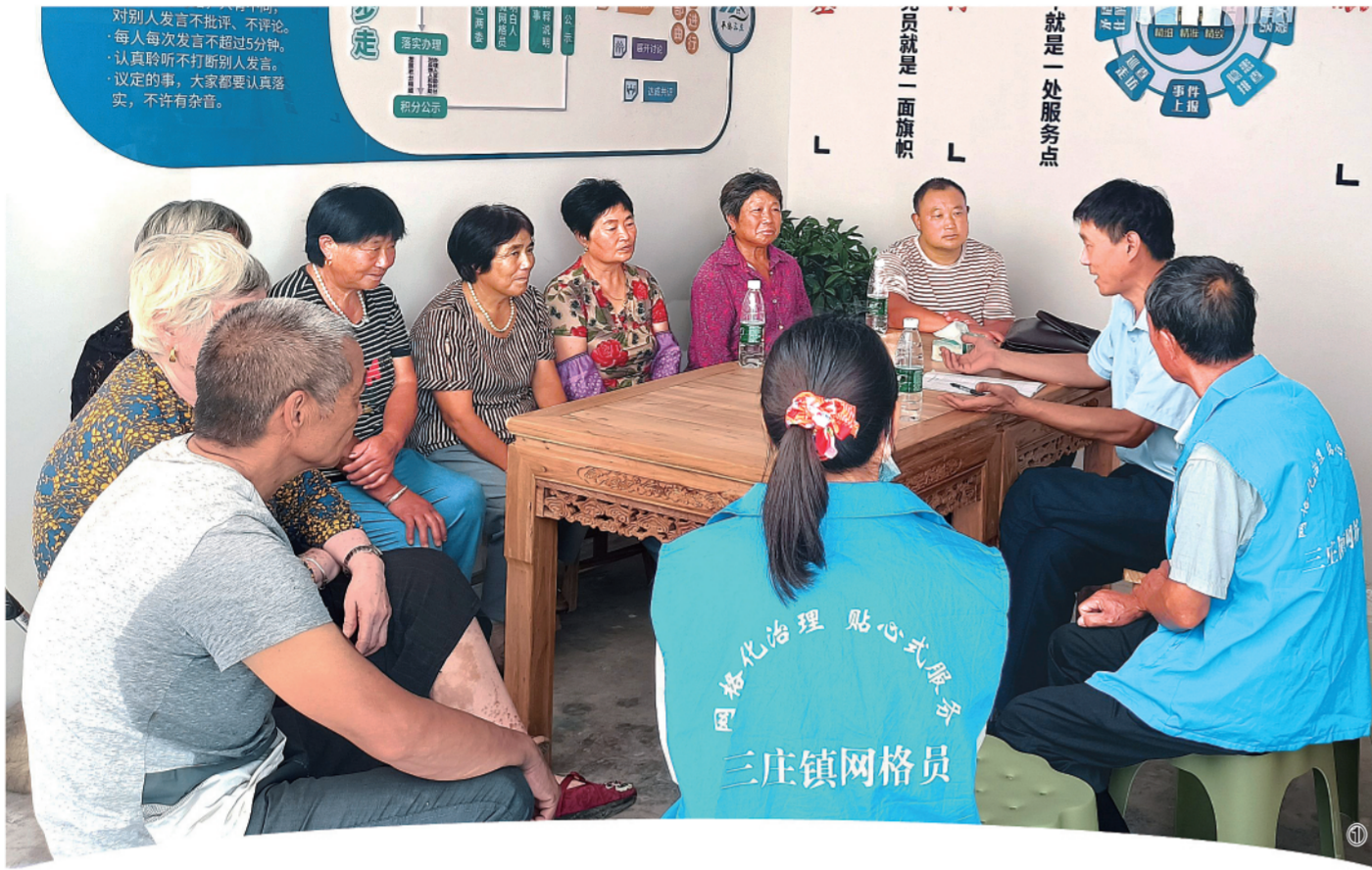
□ 本报记者 罗莎莎 文/图 □ 本报通讯员 骆乃阳 程遥

“孙主任,您还记得俺吗?这次打电话是专门来跟您道个谢。”4月17日,江苏省泗阳县三庄法律服务所主任孙兴阳接到了一个外地号码打来的电话,一个略带口音的女生在电话中连连说着感谢的话。