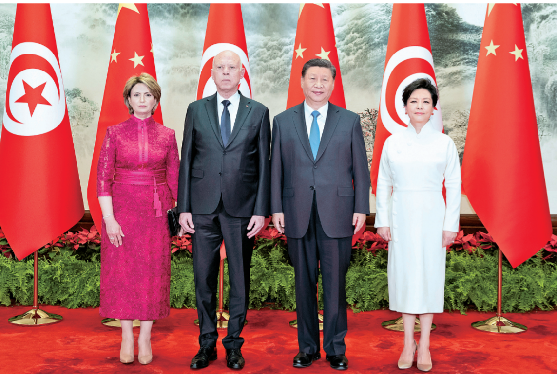
五月三十一日上午，国家主席习近平在北京人民大会堂同来华国事访问并出席中国-阿拉伯国家合作论坛第十届部长级会议开幕式的突尼斯总统赛义德举行会谈。这是会谈前，习近平和夫人彭丽媛同赛义德和夫人伊什拉芙合影。

新华社北京5月31日电 记者郑明达 王宾 5月31日上午，国家主席习近平在北京人民大会堂同来华国事访问并出席中国-阿拉伯国家合作论坛第十届部长级会议开幕式的突尼斯总统赛义德举行会谈。两国元首宣布，建立中突战略伙伴关系。 习近平指出，中国和突尼斯是好朋友、好兄弟。建交60年来，无论国际风云如何变幻，中突双方始终相互尊重、平等相待、彼此支持，谱写了发展中国家风雨同舟、守望相助的生动篇章。巩固好、发展好中突关系，符合两国人民的根本利益和共同期待。中方愿同突方一道，赓续传统友谊，深化各领域交流合作，推动中突关系迈上新台阶。今天我们宣布建立中突战略伙伴关系，必将开辟两国关系更加美好的未来。 习近平强调，中方支持突尼斯走符合自身国情的发展道路，支持突方独立自主推进改革进程，将命运牢牢掌握在自己手中。中方愿同突方加强发展战略对接，深化基础设施建设、新能源等领域合作，培育医疗卫生、绿色发展、水资源、农业等领域合作新动能，推动两国高质量共建“一带一路”取得更多