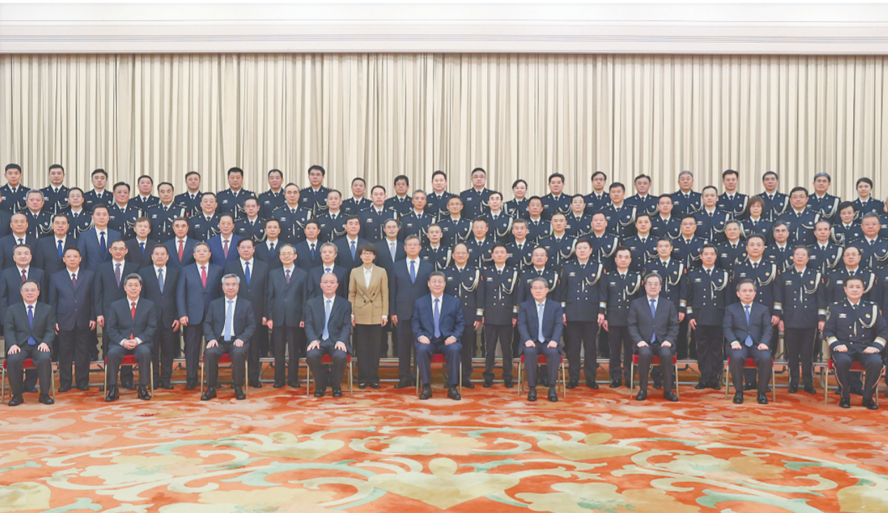
5月28日，党和国家领导人习近平、李强、蔡奇、丁薛祥、李希等在北京人民大会堂会见全国公安工作会议代表。