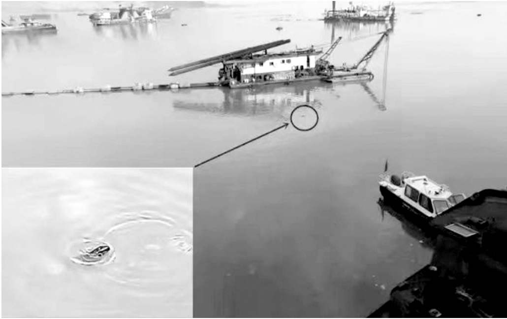
图为3月24日,中央生态环境保护督察组暗查发现,违规疏浚船只发生漏油事故,一头小江豚被困油污区域。(资料图片)

抽查发现,统计部门统计的南昌县幽兰镇氮肥、钾肥施用量均为零,农业农村部门数据显示仍在施用;南昌市经开区樵舍镇近年来因城市开发已征收耕地约3000亩,但2023年化肥施用量比2021年不降反升。在南昌县、永修县,湖区围垦的农田田埂上随处可见废弃农药包装,监测结果显示,农田沟渠水总磷浓度超湖库Ⅲ类水标准3倍至13倍。湖区还普遍存在