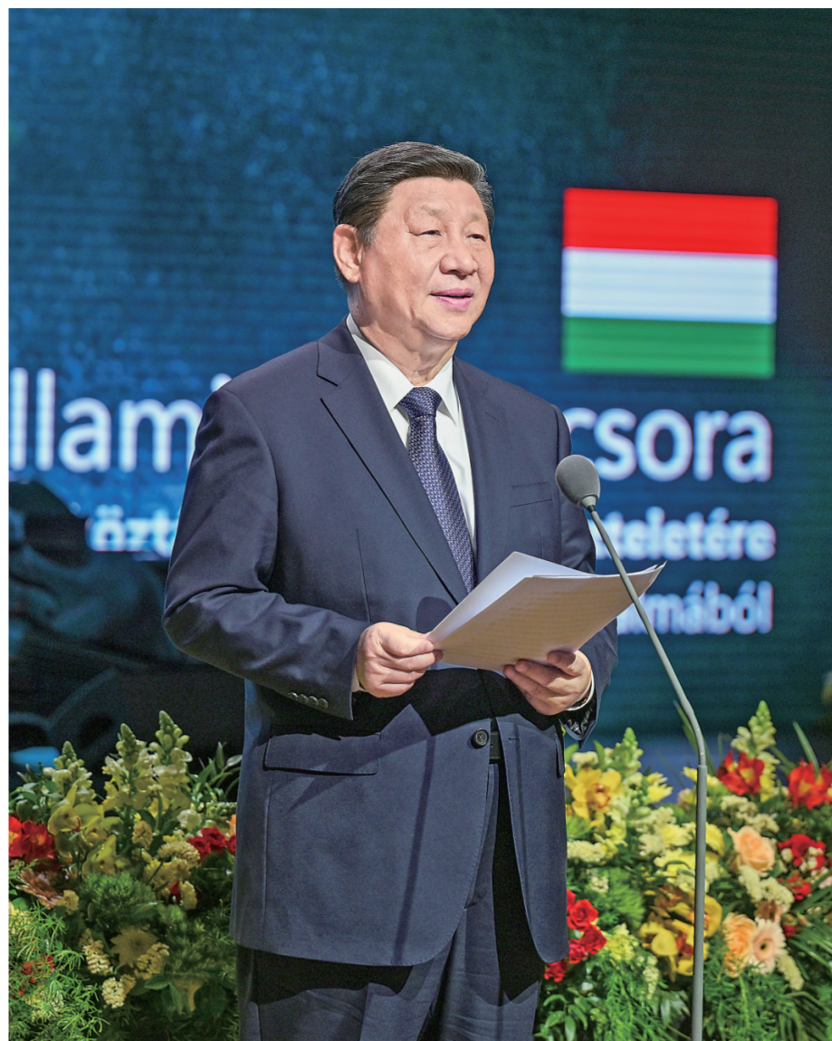
当地时间五月九日晚，国家主席习近平和夫人彭丽媛在布达佩斯城堡山出席匈牙利总理欧尔班和夫人雷沃伊举行的隆重欢迎宴会。这是习近平在宴会上致辞。