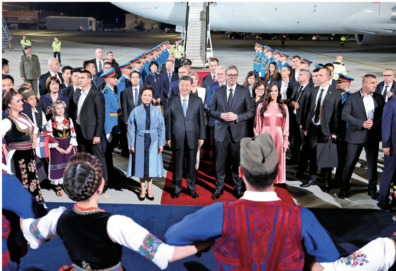
当地时间5月7日晚，国家主席习近平乘专机抵达贝尔格莱德，应塞尔维亚总统武契奇邀请，对塞尔维亚进行国事访问。习近平乘坐专机抵达贝尔格莱德尼古拉·特斯拉国际机场时，塞尔维亚总统武契奇夫妇，对华合作国家委员会主席、前总统尼科利奇夫妇，议长布尔纳比奇，总理武切维奇和外长久里奇等热情迎接。