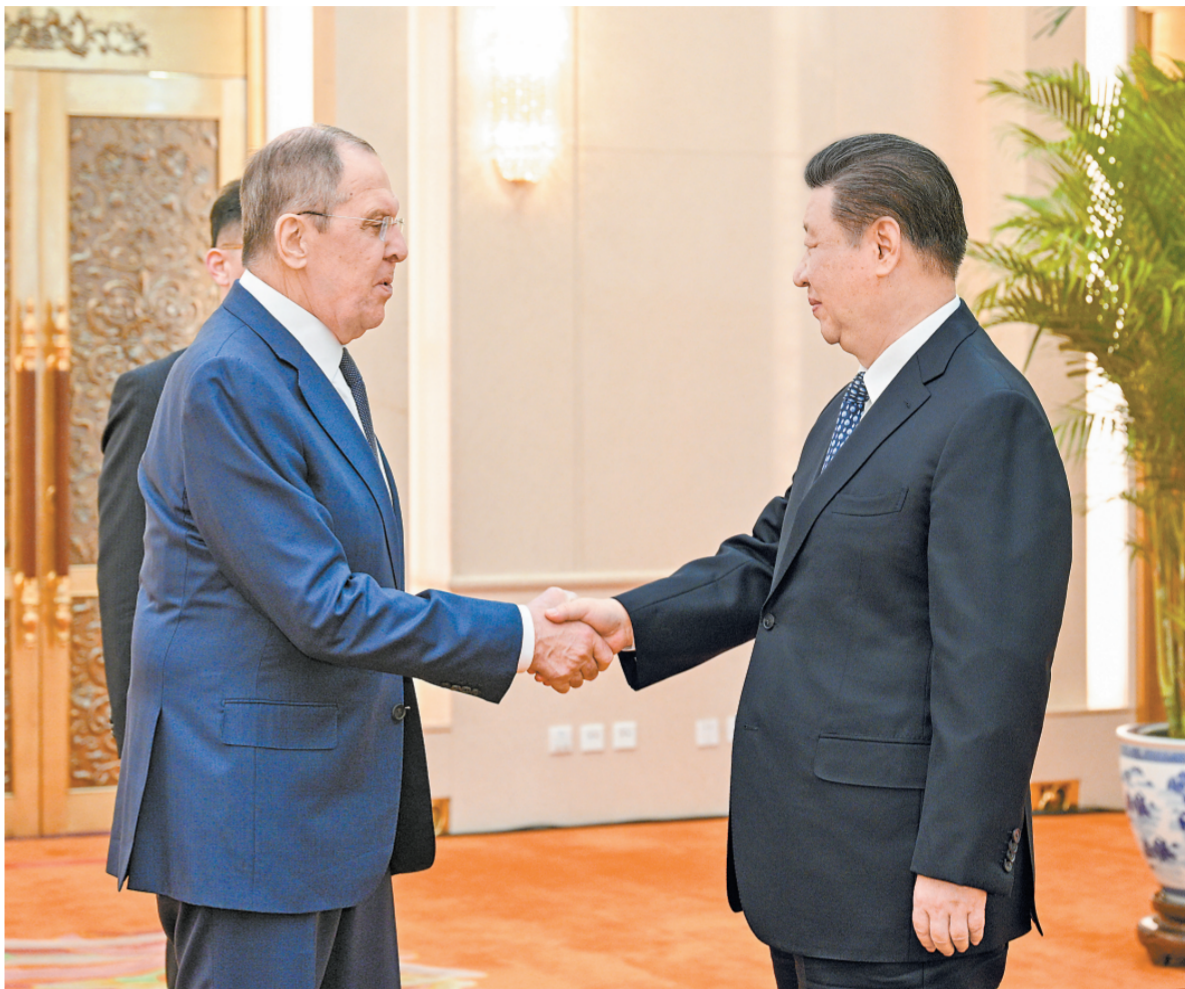
四月九日下午，国家主席习近平在北京人民大会堂会见俄罗斯外长拉夫罗夫。