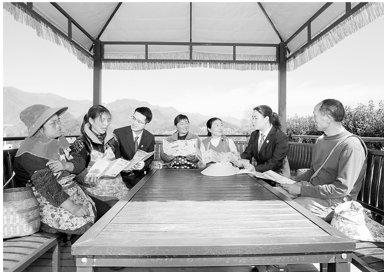
为服务地方经济发展,助力乡村振兴,近日,重庆市酉阳土家族苗族自治县人民法院将“车载便民法庭”开到宜居乡宜居村大宗堡茶园开展法治宣传活动。图为干警向茶农发放法治宣传材料,并以通俗易懂的语言解答土地承包、侵权责任等涉法问题,引导茶农树立办事依法、遇事找法、解决问题用法、化解矛盾靠法的法治观念。

尉氏县检察院检察长陈军波介绍说,检察干警在办案中,始终坚持将追赃挽损工作贯穿始终,科学运用认罪认罚从宽制度,为辖区民营企业挽回损失4000余万元。自成立以来,“护航工作室”共办理涉民营企业经济犯罪案件65件88人,荣立集体三等功一次,被河南省人民检察院评为“优秀办案团队”。