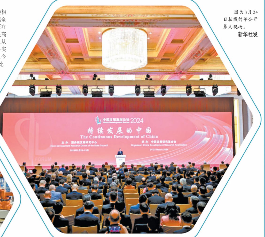
图为3月24日拍摄的年会开幕式现场。

“欧莱雅集团将继续投资中国。因为我们相信，投资中国，就是投资未来。”欧莱雅集团首席执行官叶涛