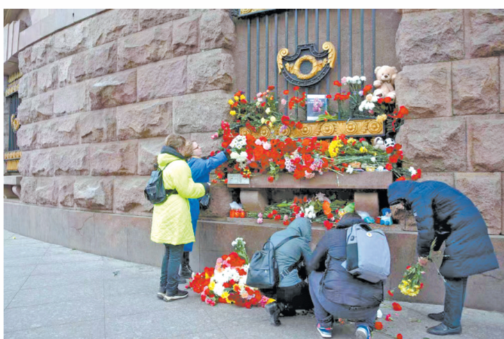
图为3月23日，在俄罗斯圣彼得堡，市民献花悼念莫斯科近郊恐袭事件遇难者。

据俄媒报道，俄联邦安全局称本次恐袭经过事先精密策划，目前俄相关部门正在努力查明事件的全部真相。俄联邦安全局宣布，已逮捕11名恐袭嫌疑人，其中4人直接实施了袭击。3月25日