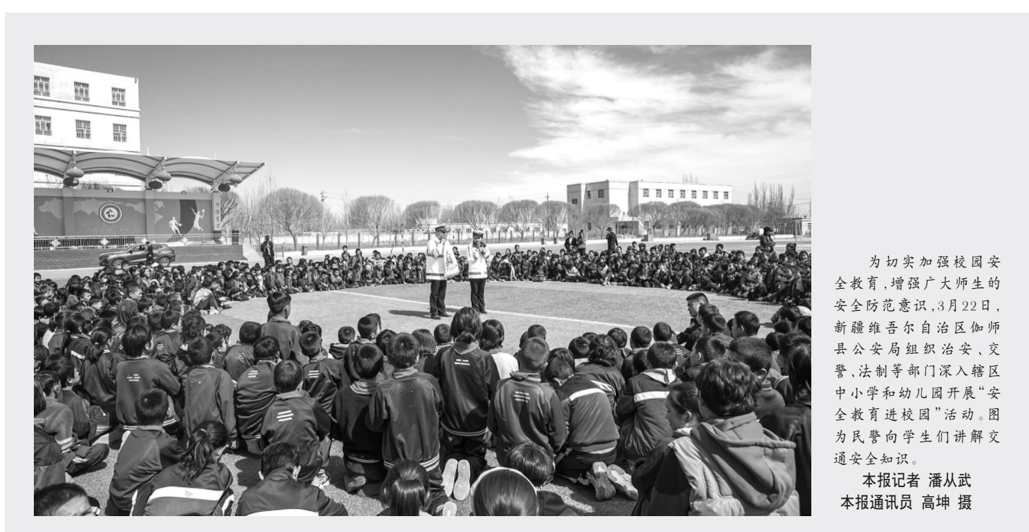
为切实加强校园安全教育,增强广大师生的安全防范意识,3月22日,新疆维吾尔自治区伽师县公安局组织公安、交警、法制等部门深入辖区中小学和幼儿园开展“安全教育进校园”活动。图为民警向学生们讲解交通安全知识。

科右中旗坚持疏堵结合、多元共治,针对各类民间借贷纠纷开展靶向服务,联合调处,2023年,通过联合调处成功化解民间借贷类矛盾纠纷349件,全年未发生一起因民间借贷纠纷导致的“民转刑”案件和信访案件。