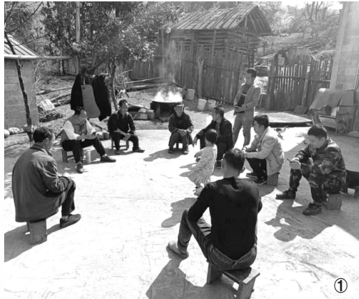
图① 网格员上门调解家庭矛盾纠纷。

近年来,西林县树立预防性司法理念,通过抓前端、抓源头、抓初始,实行“警源、诉源、访源、稳源”四源共治,打造“枫桥经验”西林模式,有效控制刑事治安案件、诉讼案件、信访案件增量,推动形成从化讼止争向少诉无争发展的良性司法生态。2023年,西林县成功化解各类矛盾纠纷1400余件。