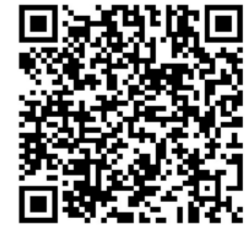
更多内容请参见《法治日报》微信公众号