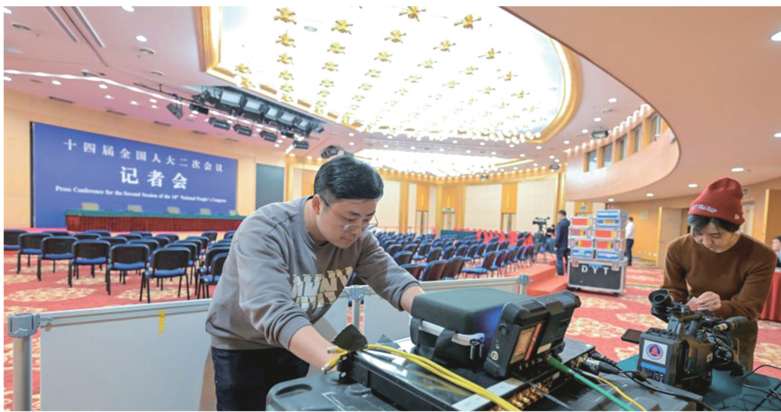
图为2月27日媒体工作人员在两会新闻中心记者会现场调试线路。

《今日巴基斯坦报》等媒体在报道中指出，今年中国的两会具有特殊意义，因为今年是新中国成立75周年，也是实现“十四五”规划目标任务的关键一年。促进