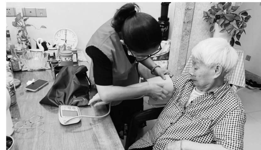
2023年6月，福建省厦门市湖里区禾山街道五缘湾北社区组织助老员上门为老年人测量血压。