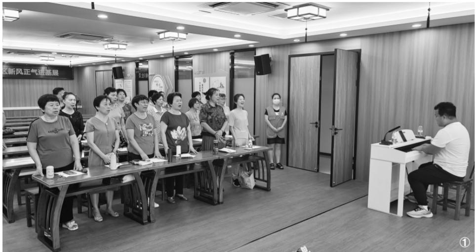
图① 2023年11月，福建省厦门市湖里区禾山街道枋湖南社区在社区新时代文明实践站开展老年人合唱团培训活动。