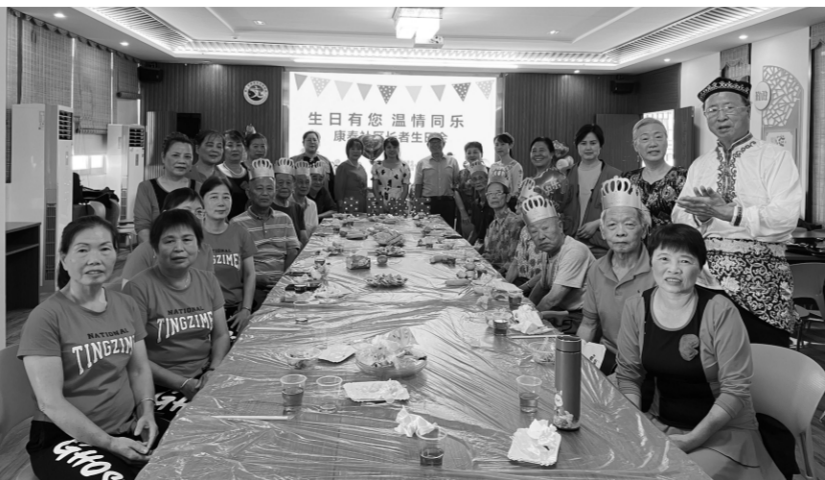
2023年9月，福建省厦门市湖里区湖里街道康泰社区举行“生日有您，温情同乐”第三季度长者生日会。