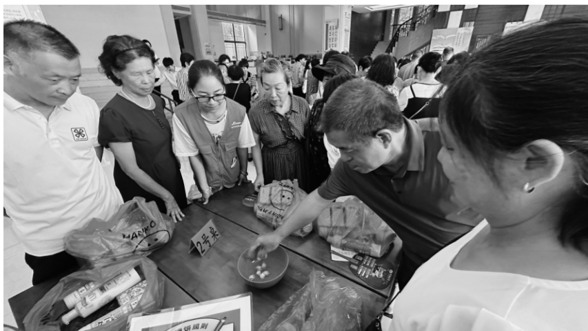
2023年9月，福建省厦门市湖里区禾山街道五缘湾北社区在社区新时代文明实践站开展“乐享中秋，悦动国庆”中老年人秋游活动。

该区以“公建民营”形式引入国企运营建设发溢倍养老中心，进一步拓宽普惠性养老服务供给渠道。同时，积极开展幸福安康险投保工作，60周岁及以上户籍老年人可免申即享意外伤害保险；安排专人定时定点入驻各街道，开通24小时紧急报警电话，为遇险老年人提供便捷高效的理赔服务。近5年来，共理赔案件2400余件，理赔金额达1700万元，有效减轻了老年人遭受意外伤害而增加的支付压力