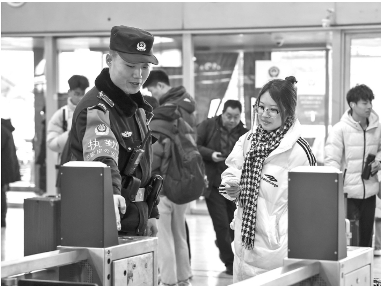
随着高校寒假开启，大学生客流持续攀升，北京铁路公安局石家庄公安处石家庄站派出所近日深入开展暖心护航行动，开通绿色通道，全力保障学生旅客平安出行。图为民警指引大学生旅客使用自动闸机进站乘车。

江郎山派出所始终贯彻“我们就是导游”“执勤就是风景”的旅游警务新理念，将警务工作延伸到景区景点和游客身边，以认真负责、细致周到的态度做好服务游客工作，“面对面”为游客提供旅游咨询、寻人、失物招领等便民服务，并在旅游警务室内配备休息椅、饮水机、急救箱等设施，以便游客使用。2023年以来，江郎山派出所共化解各类涉旅纠纷10余件，找回丢失物品39件，服务群众18万余人次，涉旅投诉“零发生”。