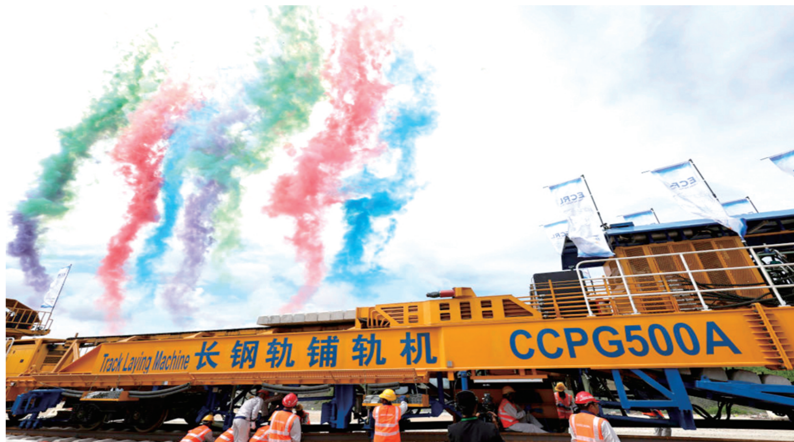
图为12月11日在马来西亚彭亨州首府关丹市拍摄的马来西亚东海岸铁路(马东铁)项目轨道工程启动仪式现场。马东铁全长600多公里，被视为连通马来西亚东西海岸的“陆上桥梁”，建成后有望带动马来西亚东海岸地区经济发展，并极大改善沿线地区互联互通水平，是中马两国共建“一带一路”重点项目。新华社发

截至今年9月30日，蒙内铁路已安全运营2314天，累计发送旅客11155万人次，平均上座率达95.8%，单日旅客最高发送量突破1万人次；累计运输240.5万个标箱，发