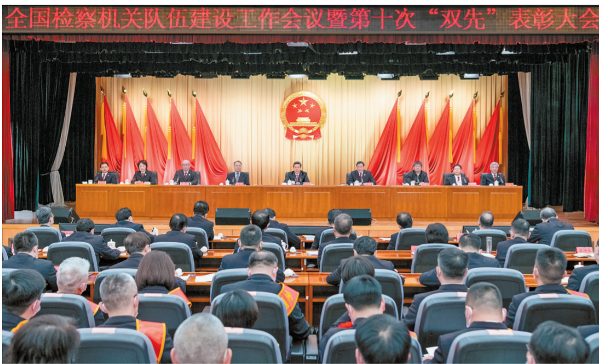
十二月二十日，全国检察机关队伍建设工作会议暨第十次先进集体先进个人表彰大会在京举行。中共中央政法委员会、中央政法委书记陈文清出席会议并讲话。

本报北京12月20日讯 记者蔡长春 全国检察机关队伍建设工作会议暨第十次先进集体先进个人表彰大会20日在京举行。中共中央政治局委员、中央政法委书记陈文清在会上强调，要坚持以习近平新时代中国特色社会主义思想为指导，深入学习贯彻习近平法治思想，努力建设一支忠诚干净担当的新时代检察铁军，为强国建设、民族复兴作出新的更大贡献。