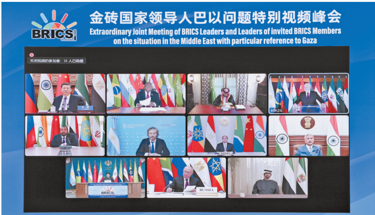
11月21日晚，国家主席习近平出席金砖国家领导人巴以问题特别视频峰会并发表题为《推动停火止战 实现持久和平安全》的重要讲话。

新华社北京11月21日电 11月21日晚，国家主席习近平出席金砖国家领导人巴以问题特别视频峰会并发表题为《推动停火止战 实现持久和平安全》的重要讲话。(讲话全文另发)