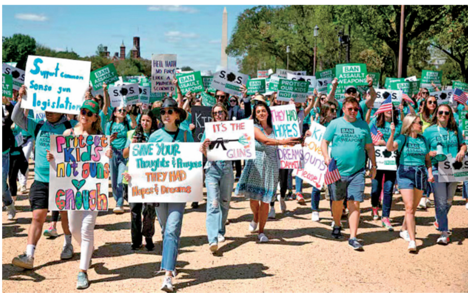
图为人们在美国首都华盛顿参加控枪游行，呼吁禁止销售攻击性武器，应对美国枪击暴力问题。

美国The Trace网站文章写道：“像尤瓦尔迪校园枪击和刘易斯顿枪击这样的事件在美国真的变得越来越普遍了吗？答案：是的。”大规模枪击事