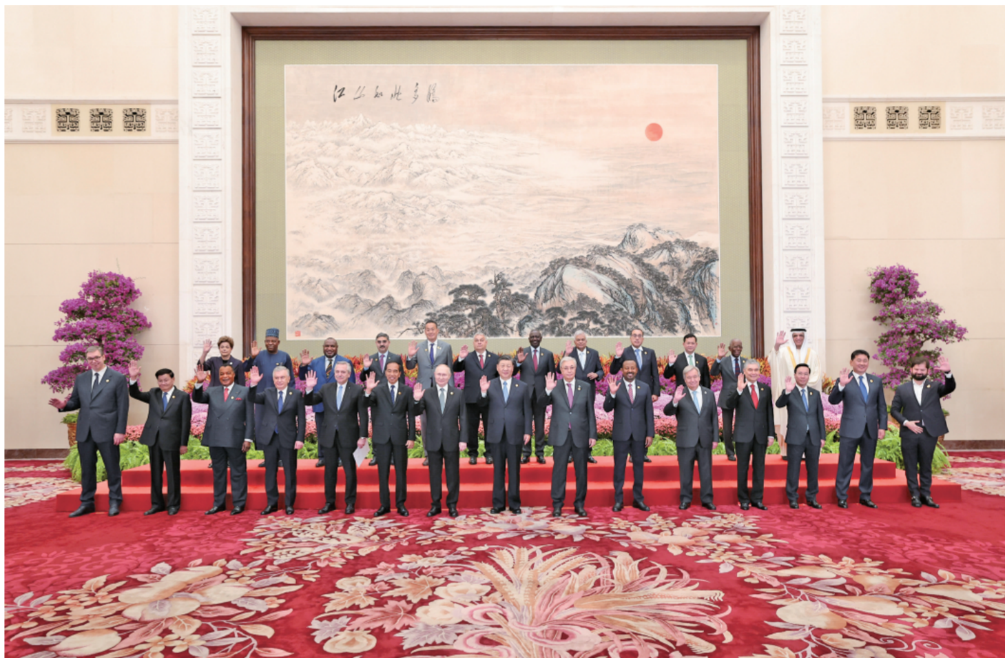
10月18日上午，国家主席习近平在北京人民大会堂出席第三届“一带一路”国际合作高峰论坛开幕式并发表题为《建设开放包容、互联互通、共同发展的世界》的主旨演讲。这是会前，习近平同出席高峰论坛的外国国家元首、政府首脑和国际组织负责人等国际贵宾集体合影。

新华社北京10月18日电 记者涂铭 孙奕 10月18日上午，国家主席习近平在人民大会堂出席第三届“一带一路”国际合作高峰论坛开幕式并发表题为《建设开放包容、互联互通、共同发展的世界》的主旨演讲。习近平宣布中国支持高质量共建“一带一路”的八项行动，强调中方愿同各方深化“一带一路”合作伙伴关系，推动共建“一带一路”进入高质量发展的新阶段，为实现世界各国的现代化作出不懈努力。 金秋时节，天高气爽，风清气正。天安门广场上，共建“一带一路”国家国旗迎风飘扬，相映成辉。 出席高峰论坛的外国国家元首、政府首脑和国际组织负责人等国际贵宾陆续抵达。人民大会堂东门外两侧大屏上，共建“一带一路”项