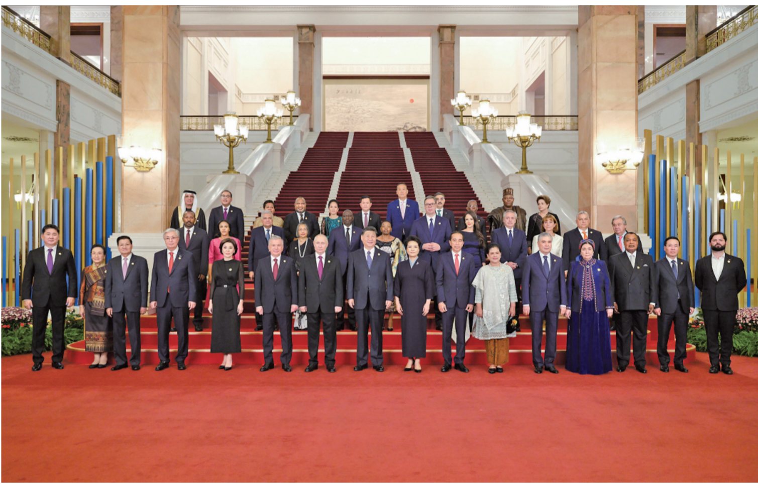
10月17日晚，国家主席习近平和夫人彭丽媛在北京人民大会堂举行宴会，欢迎来华出席第三届“一带一路”国际合作高峰论坛的国际贵宾。这是习近平和彭丽媛同国际贵宾合影留念。

新华社北京10月17日电 记者杨依军 孔祥鑫 10月17日晚，国家主席习近平和夫人彭丽媛在人民大会堂举行宴会，欢迎来华出席第三届“一带一路”国际合作高峰论坛的国际贵宾。李强、赵乐际、王沪宁、蔡奇、丁薛祥、李希、韩正出席。