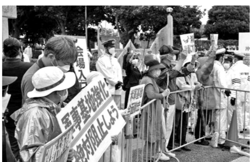
为抗议和抵制驻日美军给当地民众带来的困扰，冲绳民众不断揭批美军暴行，要求美军撤出冲绳。

为遏制接连发生的美军相关人员恶性犯罪事件，冲绳县政府和县议会此前曾要求日美两国政府举行相关协调会议(CWT)，但CWT会议自2017年4月最后一次召开后至今未再举行。有日本媒体报道指出，日本中央政府出于对美国的顾忌，对美军违法犯罪问题不愿深究，这在客观上助长了驻日美军的违法犯罪行为。