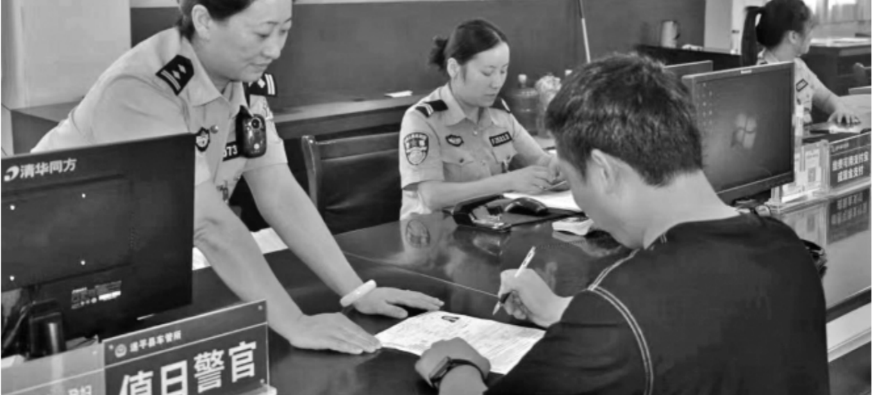
河南省遂平县公安局交警大队始终践行服务至上理念，将提供优质、高效、便捷的服务作为工作的出发点和落脚点，得到了辖区群众的一致好评。图为近日该大队车管所民警向驾驶人讲解业务办理流程。

聚焦上级交办案和本市重点问题，全面推行一包到底领导包案接访化解制度，各级包案领导务担当、敢接敢化，其中市委书记专挑化解难度最大的信访人见面沟通，直钻矛盾窝里找答案。2022年至今，乐清市32名市级领导干部带头包案接访化解信访积案371件，200余名科局级干部包案接访化解重点信访问题425件，成功实现省级无信访积案县(市、区)五连创。