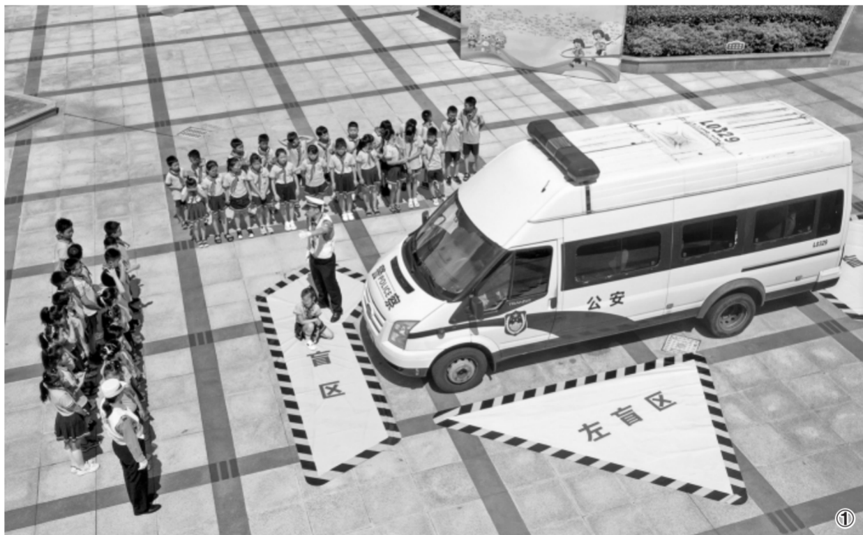
图① 9月1日,浙江省岱山县公安局交警大队民警结合夏季治安打击整治行动,开展“开学第一课 交通安全教育进校园”主题活动,民警通过识别各类交通标识和案例讲解,向学生宣讲交通法规及常识。图为民警向学生讲解车辆盲区安全知识。