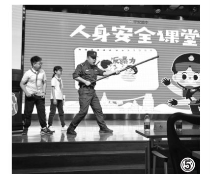
图⑤ 重庆警方以“护学模式”拧紧校园“安全阀”,全力护航金秋开学季。图为9月1日渝中区公安分局特警支队民警向学生传授防身技术和自我保护技巧。