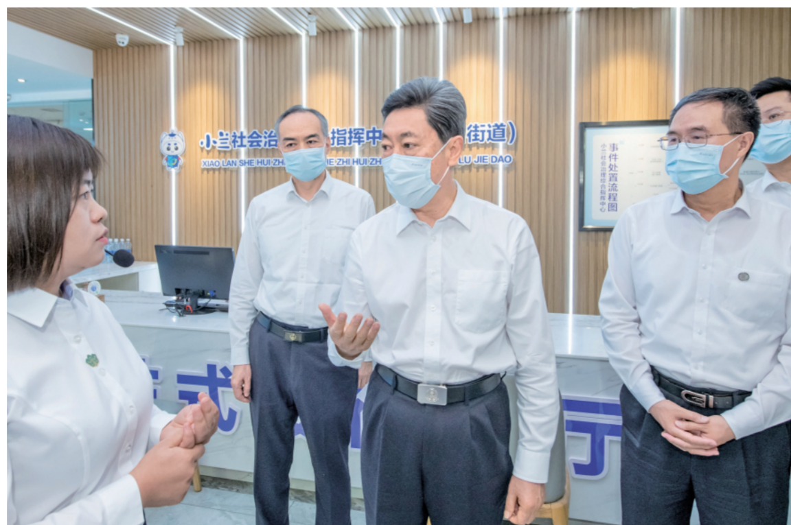
“枫桥经验”，着力化解矛盾纠纷，切实把问题解决在萌芽状态、化解在基层。甘肃政法机关要以开展主动创稳行动为抓手，强化社会治安综合治理，推进信访工作法治化，确保社会大局持续稳定。 陈文清指出，党的二十大要求，在法治轨道上全面建设社会主义现代化国家，全面推进国家各方面工作法治化，这是对中国式现代化建设规律的深刻把握。政法机关要深入贯彻习近平法治思想，全面推进科学立法、严格执法、公正司法、全民守法，依法维护社会主义市场经济秩序，依法维护人民群众权益，依法保护生态环境，为中国式现代化建设提供有力法治保障。 中央政法委书记王晨，中央政法委员会秘书长王怡星，甘肃省常委、政法委书记刘长根等参加调研。

本报 记者蔡长春 中共中央政治局委员、中央政法委书记陈文清22日至24日在甘肃调研时强调，要坚持以习近平新时代中国特色社会主义思想为指导，深入贯彻习近平法治思想和总体国家安全观，奋力开创甘肃政法工作新局面，为服务保障中国式现代化作出新贡献。 陈文清深入兰州白银路街道、临夏纳沟村、甘南当道镇等街道乡村调研。他指出，在以习近平总书记为核心的党中央坚强领导下，新时代富民兴陇事业大步向前，呈现经济发展、社会稳定、民族团结的良好局面。中国式现代化是强国建设、民族复兴的康庄大道，新时代新征程，政法机关和政法干警要深刻领悟“两个确立”的决定性意义，深刻把握政法战线在中国式现代化建设中的历史使命和职能作用，忠诚履职、担当作为，以政法工作现代化服务保障中国式现代化。 在甘南，陈文清调研了涉藏维稳工作，出席了部分省区涉藏维稳工作会议。他强调，在推进中国式现代化建设新征程上，必须旗帜鲜明维护祖国统一，反对民族分裂，确保国家安全。要深入贯彻新时代党的治藏方略，前瞻部署工作，扭住工作重点，落实工作责任，主动防控风险，坚决维护西藏和四省涉藏州县长治久安。 在基层政法单位调研时，陈文清指出，社会稳定是国家强盛的前提。要推动落实党委主体责任、部门主管责任，全力防范化解风险挑战，为推进中国式现代化建设创造安全稳定的社会环境。要坚持和发展好新时代