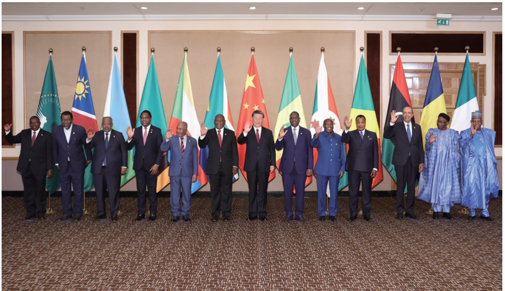
当地时间8月24日晚，国家主席习近平和南非总统拉马福萨在约翰内斯堡共同主持中非领导人对话会。

新华社约翰内斯堡8月24日电 记者韩墨 金正 当地时间8月24日晚，国家主席习近平和南非总统拉马福萨在约翰内斯堡共同主持中非领导人对话会。 非盟轮值主席、科摩罗总统阿扎利，中非合作论坛非方共同主席国、塞内加尔总统萨勒，非洲次区域组织代表赞比亚总统希奇莱马、布隆迪总统恩达伊施米耶、吉布提总统盖莱、刚果(布)总统萨苏、纳米比亚总统根哥布、乍得总理凯布扎博、利比亚总统委员会副主席库尼、尼日利亚副总统谢蒂马，以及非盟委员会代表穆昌加等出席。 习近平发表题为《携手推进现代化事业 共创中非美好未来》的主旨讲话。(讲话全文另发) 习近平指出，这是我第十次踏上非洲大陆。2013年我担任中国国家主席后，首次出访就来到非洲，提出真实亲诚对非政策理念。10年来，我们秉持这一理念，同非洲朋友一道，从中非友好合作精神中汲取力量，在团结合作的道路上坚定前行，在国际风云变幻中坚守道义，在新冠疫情冲击下守望相助，推动中非关系不断迈上新台阶，进入共筑高水平中非命运共同体的新阶段。