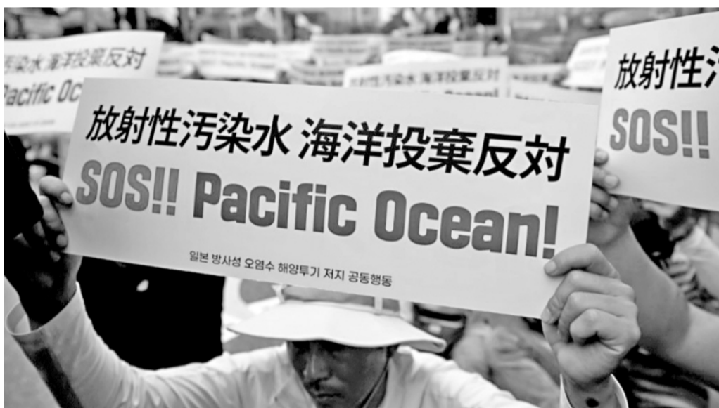
图为韩国民众在首尔手举标语牌参加集会,反对日本核污染水排海。