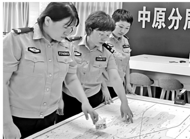
河南省郑州市公安局以夏夜治安巡查宣防集中统一行动为抓手，实行挂图作战，综合落实打击整治、街面布防、集中清查、宣传防范等措施，不断提升人民群众安全感。图为近日，中原分局指挥中心民警研判治安警情。