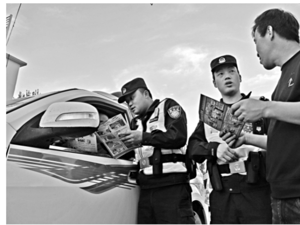
新疆出入境边防检查总站昌吉边境管理支队南边境派出所近日联合马纳斯口岸边境派出所和苏吉边境检查站开展夏夜治安巡查宣防集中统一行动。图为民警向辖区群众开展法治宣传。