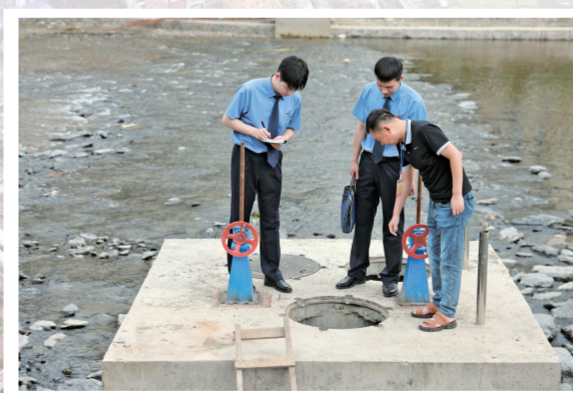
2023年7月12日,检察官与人大代表对东河污水管网修复工程开展“回头看”,现场检查新建的污水倒虹吸井运转状况。