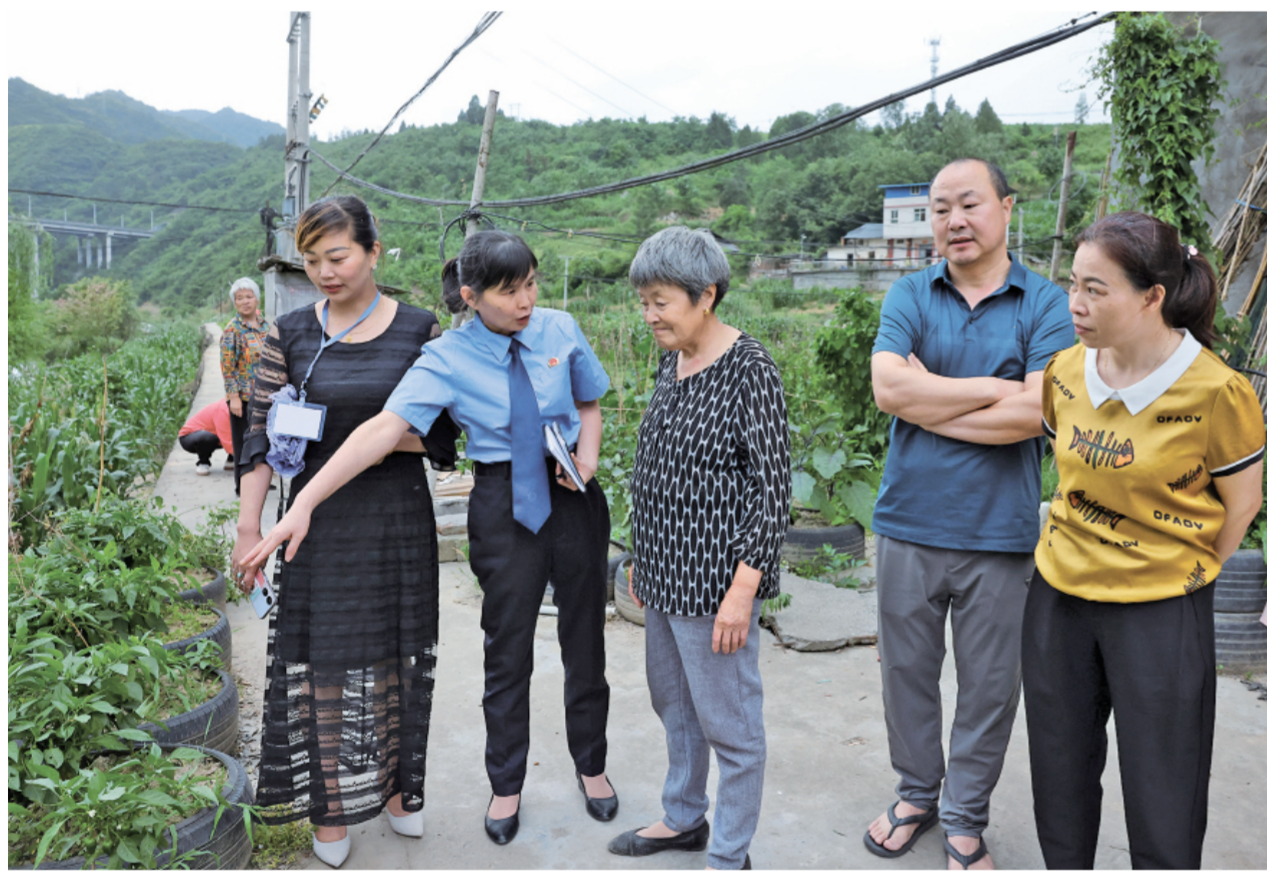
2022年5月17日,根据人大代表建议转办函反映的问题,检察官向东河附近村民调查了解管网损毁和影响情况。