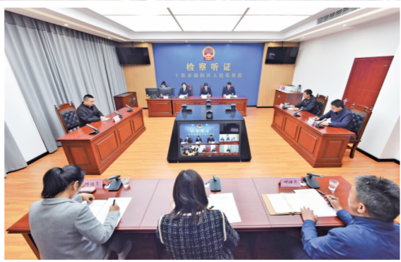
2022年10月28日,检察机关召开公开听证会,检察官向听证员汇报调查情况,听取各方意见和建议。