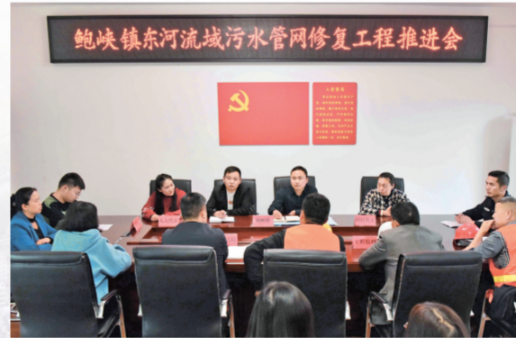
2023年3月21日,鲍峡镇人民政府组织人大代表、村民代表、施工方召开东河流域污水管网修复工程推进会。