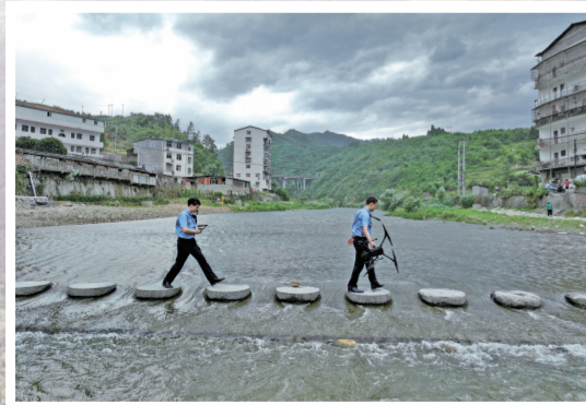
2022年5月21日,检察官带着无人机沿河对东河污水管网损毁情况进行航拍取证,固定证据。

“人大代表提出的建议,集中反映了人民群众对美好生活的期盼,从代表建议中发现案件线索,从办理个案到凝聚各方合力形成齐抓共管的良好局面,促进社会治理,这正是代表建议与检察建议双向衔接转化机制的意义所在。”十堰市人民检察院检察长刘少军说。