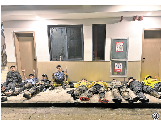
图3 7月22日晚,浙江省杭州市富阳区一山体因持续暴雨发生滑坡,富阳公安分局组织警力及时将8名被困群众转移到安全地带,图为救援小组在连夜救援后就地休息。