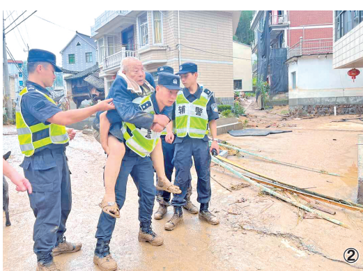
图2 7月22日晚,浙江省杭州市富阳区一山体因持续暴雨发生滑坡,富阳公安分局组织警力350余名开展紧急救援,图为民警背中风老人转移至安置点。