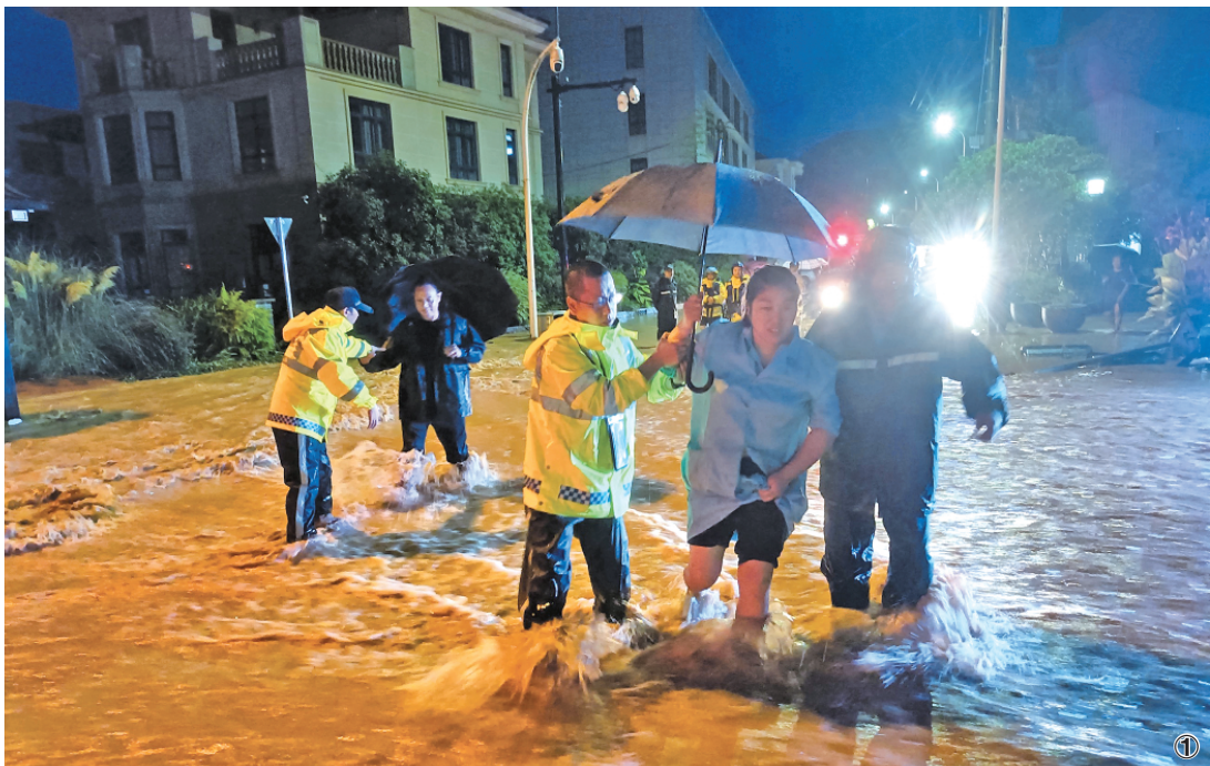
图1 7月22日晚,浙江省杭州市萧山区塔塘镇因暴雨引发汛情及塌方,辖区派出所民辅警协助疏散转移群众60余人,救助被困人员20余名。