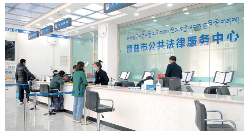
图为群众在那曲市公共法律服务中心办理业务。

那曲市公共法律服务中心作为西藏自治区首个市级公共法律服务中心，于2018年10月正式挂牌设立。为切实解决农牧民群众