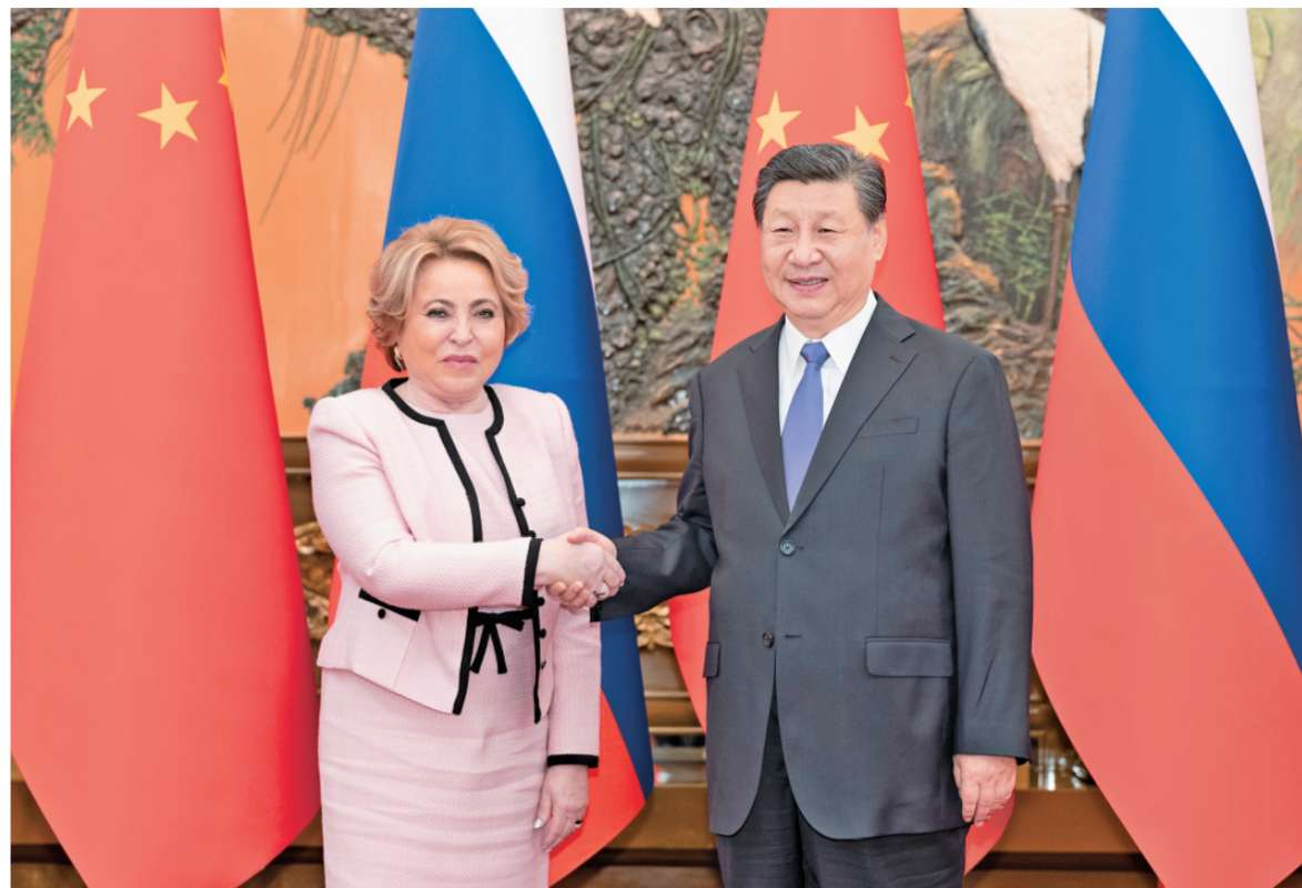
七月十日下午，国家主席习近平在北京人民大会堂会见俄罗斯联邦委员会主席马特维延科。

新华社北京7月10日电 记者郑明达 国家主席习近平7月10日下午在人民大会堂会见俄罗斯联邦委员会主席马特维延科。