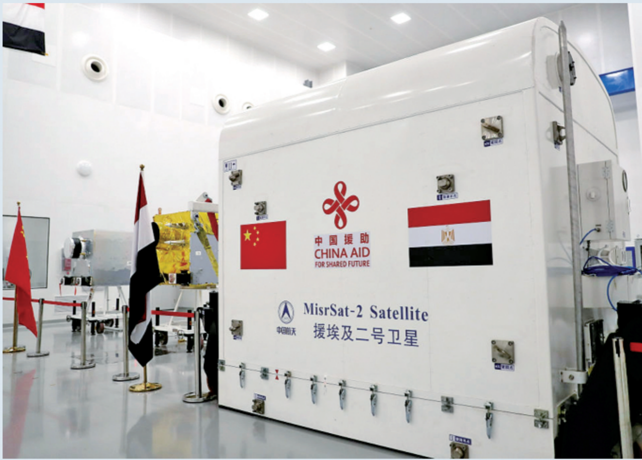
图为6月25日,中国政府援助埃及二号卫星开舱交付仪式在埃及航天城卫星总装集成测试(AIT)中心举行。此次交付使埃及成为首个具备卫星总装、集成和测试能力的非洲国家。

球发展倡议的框架下,中方牵头建立了合作机制,围绕八大重点领域建立了合作平台,确定了倡议的合作方式,并实施了具体的合作项目,这些都充分体现了中国