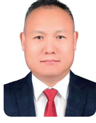
魏利 内蒙古自治区赤峰市市委常委、纪委书记,监察委员会主任