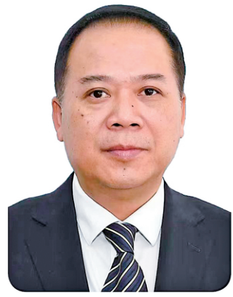
农化 广西壮族自治区崇左市委常委、政法委书记