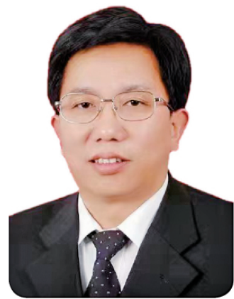
丁建成 宁夏回族自治区吴忠市市委常委、政法委书记