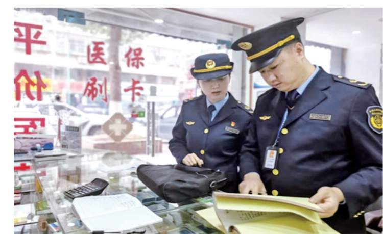
长沙县行政执法局执法人员正在辖区某诊所检查。

“改革后，执法效率得到加强，确实解决了各部门间互相推诿的现象，方便了老百姓办事。”历经三轮深改，十余年探索，湖南省长沙县跨部门跨领域综合执法改革，构建起了全域覆盖、无缝衔接、监管有力、运转高效的执法体制，推动社会治理能力大提升、县域经济发展大提速。2022年，长沙县“打造严格规范公正文明执法样板”获评第二批“全国法治政府建设示范项目”。