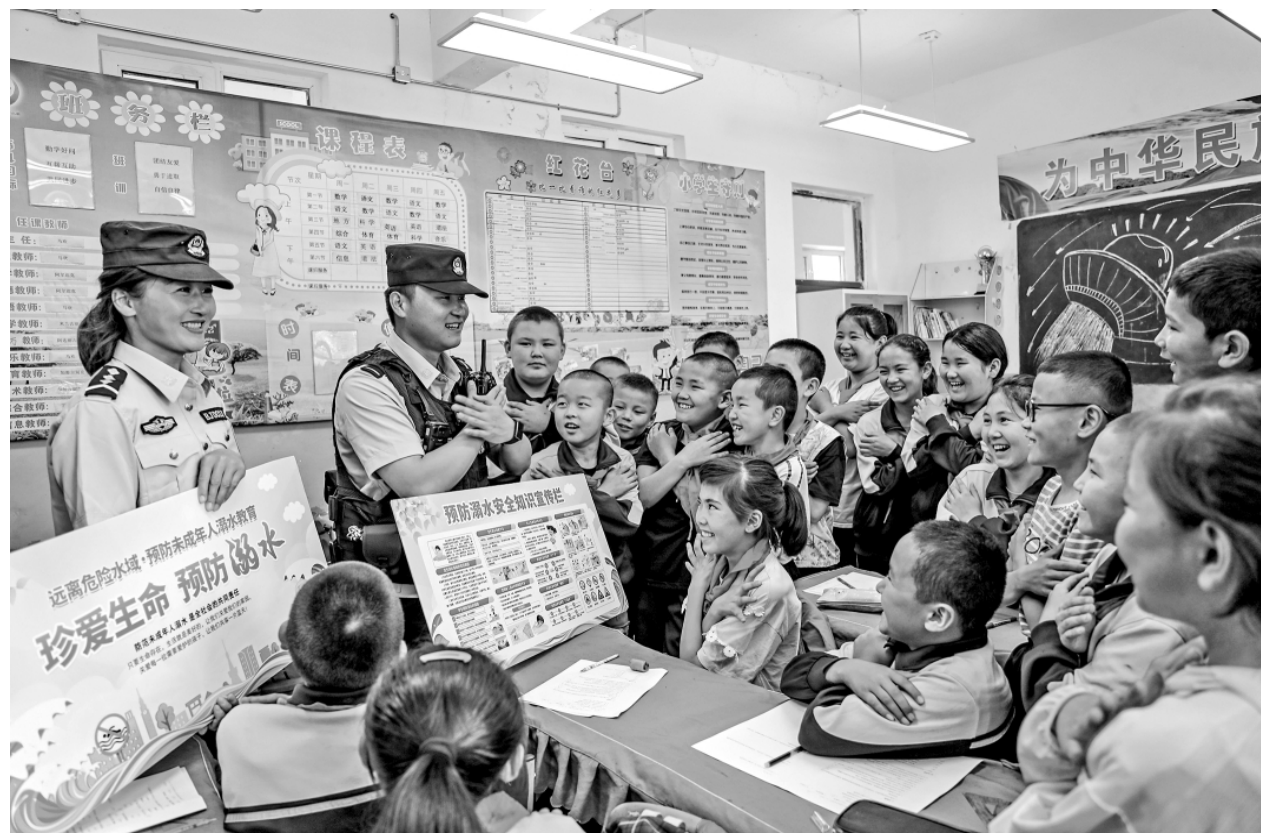
6月15日，新疆出入境边防检查总站阿勒泰边境管理支队富蕴大队吐尔洪边境派出所的民辅警走进吐尔洪乡中心小学，开展暑期安全教育活动。图为活动现场。

秦皇岛检察院推动党建与业务互促互融 通讯员张兴达 单丽 近年来，河北省秦皇岛市人民检察院始终坚持检察业务开展到哪里，党建工作就推进到哪里，紧紧围绕中心抓党建、抓好党建促业务，健全落实机关党建和检察业务“一肩挑”机制，大力推广“党建红·检察蓝”党建品牌创建战略，有效促进党建与检察业务工作深度融合，以高质量党建引领检察工作高质量发展，打造出一批富有秦皇岛检察特色的“蓝焰焰”、低“丽”前行等党建工作品牌，实现“1+1>2”的效果。 截至目前，秦皇岛市人民检察院推广“党建+业务”系列活动80余场次，串联各业务条线及9个基层检察院，共同打造党建与业务互促互融工作模式，逐步实现党建全覆盖、全方位、全角度的辐射引领作用。该院“蓝焰焰”品牌文字作品、美术作品获得中华人民共和国国家版权局登记，卢龙县人民检察院被河北省人民检察院评为“全省检察机关基层党支部标准化规范化建设示范点”。