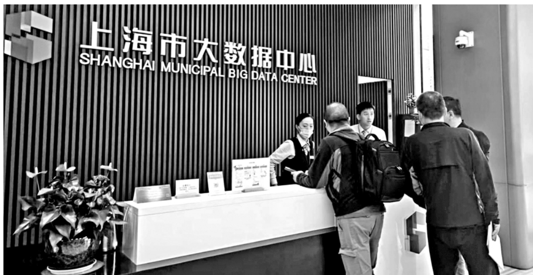
图为群众在上海市大数据中心咨询相关业务。

“令人印象深刻的是营商环境持续优化，尤其在优化营商环境法治化营商环境、深化包容审慎监管方面，为外企扎根中