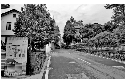
图为浙江省衢州市龙游县溪口镇街景。

衢州市龙游县溪口，过去是一个黄铁矿职工生活区，因产业转型热闹不复以前。2019年溪口镇乘着浙江省持续深化“千万工程”的东风，探索“乡村未来社区”概念，加快推进交通、教育、医疗、文化配套集聚，实施环境综合