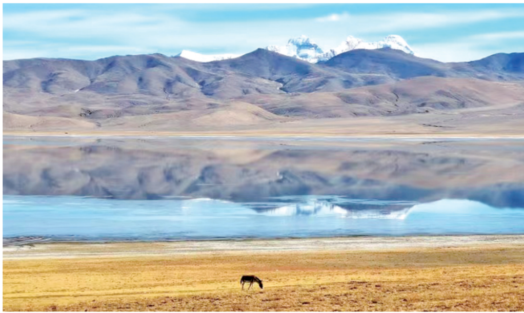
图为一头藏野驴在位于西藏自治区山南市措美县的哲古错旁吃草。

5月29日,中国2022年生态环境“成绩单”出炉。这份由生态环境部公布的《2022年中国生态环境状况公报》(以下简称《公报》)显示,2022年全国生态环境质量保持改善态势。环境空气质量稳中向好,地表水环境质量持续向好,管辖海域海水水质总体稳定,土壤环境风险得到基本管控,自然生态状况总体稳定,城市声环境质量总体稳定,核与辐射安全态势总体平稳。根据《公报》,大气环境方面,339个地级及以上城市细颗粒物浓度为29微克/立方米,比2021年下降3.3%,好于年度目标4.6微克/立方米。水环境方面,全国地表水Ⅰ~Ⅲ类水质断面比例为87.9%,比2021年上升3个百分点,好于年度目标41个百分点;劣Ⅴ类水质断面比例为0.7%,比2021年下降0.5个百分点。海洋环境方面,夏季一类水质海域面积占管辖海域面积的97.4%,近岸海域优良(一、二类)水质面积比例为81.9%,比2021年上升0.6个百分点;劣四类水质面积比例为8.9%,比2021年下降0.7个百分点。土壤环境方面,全国土壤环境风险得到基本管控,重点建设用地安全利用得到有效保障,农用地土壤环境状况总体稳定,耕地质量平均等级为4.76等,水土流失面积为267.42万平方公里。