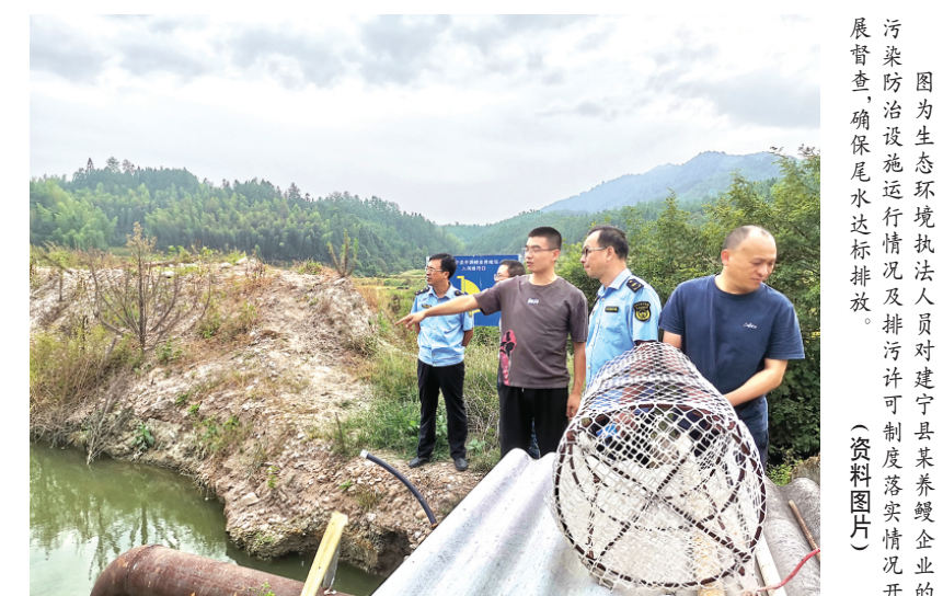
图为生态环境执法人员对建宁县某养鱼企业的污染防治设施运行情况进行检查，确保尾水达标排放。(资料图片)