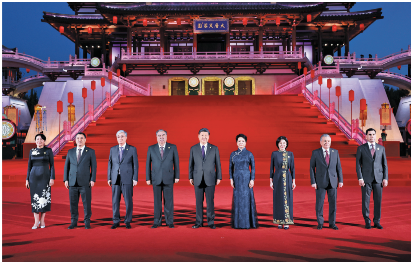
5月18日晚,国家主席习近平和夫人彭丽媛在陕西省西安市大唐芙蓉园为出席中国-中亚峰会的中亚国家元首夫妇举行欢迎仪式和欢迎宴会。宴会后,习近平夫妇同贵宾们共同观看中国同中亚国家人民文化艺术年暨中国-中亚青年艺术节开幕式演出。这是习近平夫妇在紫云楼前同贵宾们合影留念。

新华社西安5月18日电 记者温馨 蔡馨逸 5月18日晚,国家主席习近平和夫人彭丽媛在陕西省西安市大唐芙蓉园为出席中国-中亚峰会的中亚国家元首夫妇举行欢迎仪式和欢迎宴会。 维夏之月,百卉俱开。暮色中的大唐芙蓉园楼阁巍峨,流光溢彩,美轮美奂。 哈萨克斯坦总统托卡耶夫、吉尔吉斯斯坦总统扎帕罗夫和夫人扎帕罗娃、塔吉克斯坦总统拉赫蒙、土库曼斯坦总统别尔德穆哈梅多夫、乌兹别克斯坦总统米尔济约耶夫和夫人米尔济约耶娃陆续抵达。