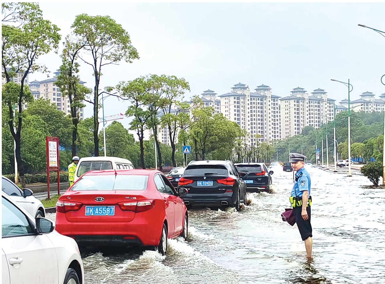
近日,江西省新余市遭受强降雨袭击,城区部分道路积水严重,不少车辆及群众被困。新余市公安局交警支队民警迅速奔赴抢险救援第一线,全力开展排险解困工作,图为民警涉水疏导指挥交通。