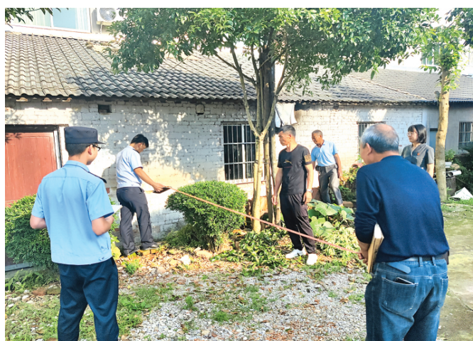
图为江山市公安、法院、规划和街道综合治理联合执法。

立足打通基层依法治理“最后一公里”的目标定位,衢州市探索实施“县乡一体、条抓块统”县域基层治理系统改革,着力构建法治为基、利民为本、整体智治、协同高效的县域治理新格局, 下转第三版