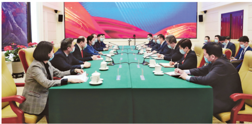
图为4月26日，司法部部长贺荣在京会见香港特别行政区保安局局长邓炳强率领的香港纪律部队文化交流团。