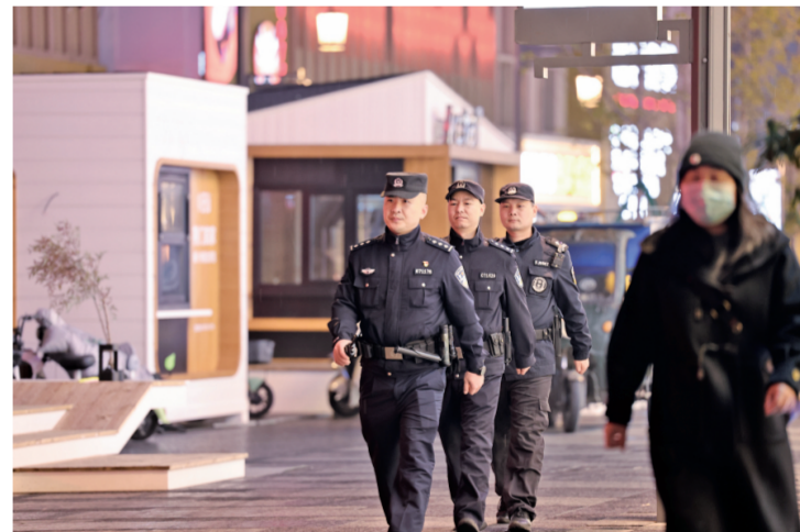
4月10日,警务站民警们在巡区步行街巡逻。