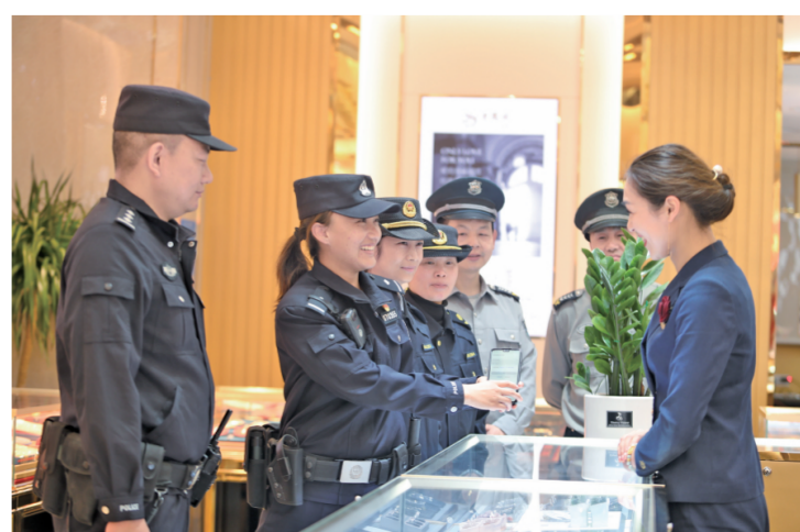
4月6日,警务站巡逻组深入巡区发动商家及单位内保部门加入治安联防联控群。