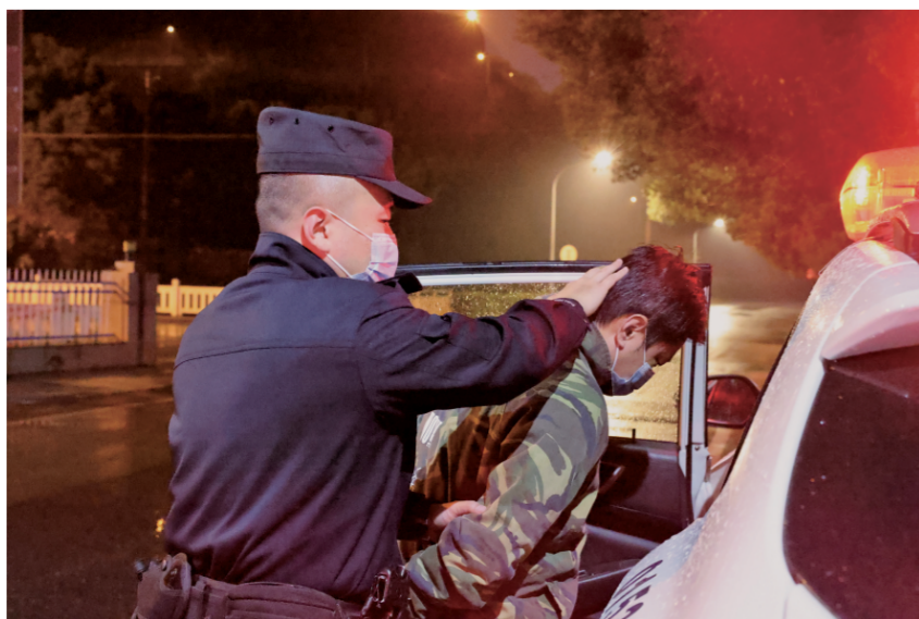
3月7日,在重庆市实施盗窃的犯罪嫌疑人逃窜至荆门市区。警务站民警仅用2小时,就将4名犯罪嫌疑人抓获。图为其中一名犯罪嫌疑人被抓。