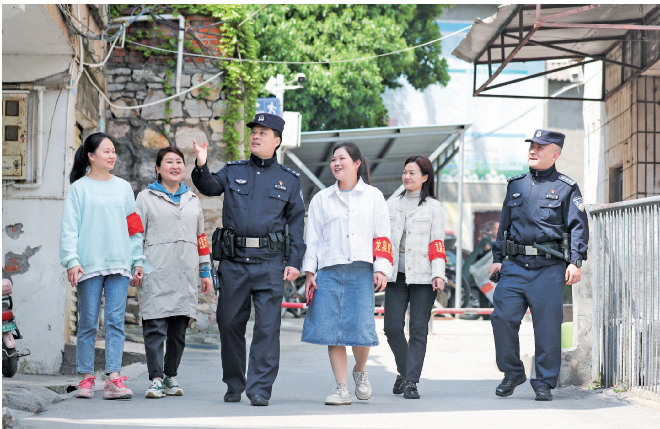
4月10日,警务站民警与龙山社区工作人员联合开展例行的联巡联防,查找巡区安全隐患,并互通治安情况。