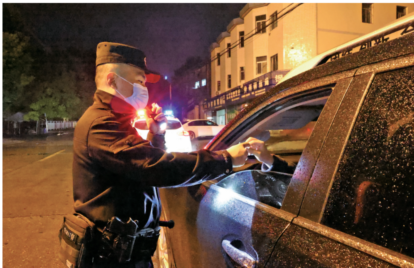
4月2日晚,警务站巡逻组正在城区道路设卡盘查。