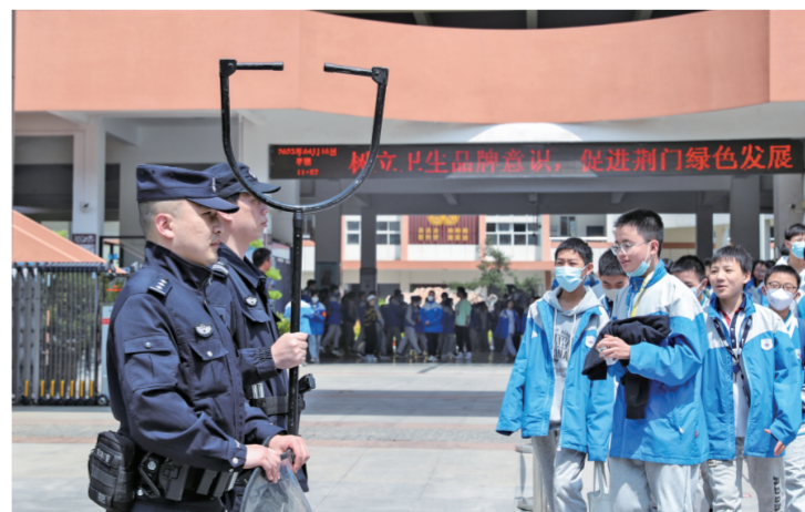
4月11日,警务站民警们在海慧中学开展护校工作。