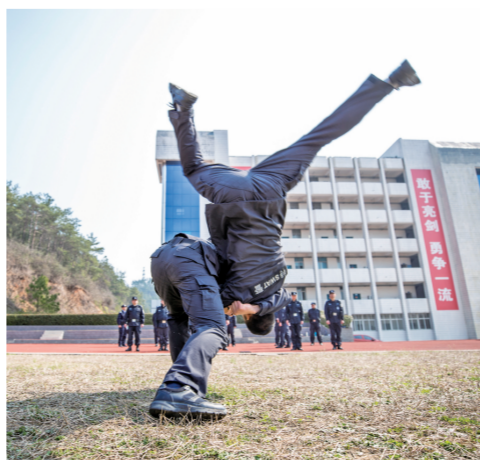
为了提升能力素质,警务站定期组织巡逻民辅警开展警事技能训练。