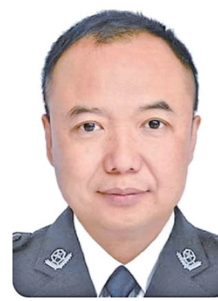
雷虎 广东省清远市副市长，市公安局党委书记、局长

我们要认真贯彻落实党的二十大精神，在改革完善法学院校体系，加快完善法学教育体系，创新发展法学理论研究体系等方面发挥积极作用，培养出更多高素质的法治人才，取得更多高质量研究成果，争取早日建成中国特色社会主义一流的法律院校，为强国建设提供有力的人才保障。