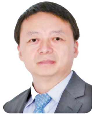
马怀德 全国政协委员、中国政法大学校长

不久前，中共中央办公厅、国务院办公厅印发了《关于加强新时代法学教育和法学理论研究的意见》（以下简称《意见》）。这是党和国家专门围绕法学教育和法学理论研究发布的重要文件，明确了我国法学教育和法学理论研究的中长期发展目标，从坚持正确政治方向、改革完善法学院校体系、加快完善法学教育体系、创新发展法学理论研究体系等方面作出详细部署。为今后一个时期建设中国特色、世界一流法学院校、造就一批具有国际影响力的法学专家学者、持续培养大批德法兼修的高素质法治人才指明了方向，对形成内容科学、结构合理、系统完备、协同高效的法学教育体系和法学理论研究体系具有重要意义。今年全国两会期间，做好新时代法学教育和法学理论研究也是从事法学教育领域的代表委员的重点议题。