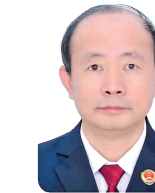
陈明 陕西省西安市人民检察院党组书记、检察长

党的二十大报告提出，加强检察机关法律监督工作。今年中央政法工作会议明确要求奋力推进政法工作现代化。检察工作现代化是政法工作现代化、国家治理现代化的题中应有之义。新时代新征程，陕西省西安市检察机关必须深入贯彻《中共中央关于加强新时代检察机关法律监督工作的意见》，忠诚履职、创新履职、能动履职，以检察工作现代化服务中国式现代化。